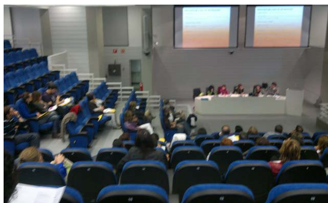
Imagen del auditorio

A resaltar la coincidencia entre la inauguración y el comunicado de ETA sobre el abandono de la violencia, lo que supuso una inmejorable noticia.