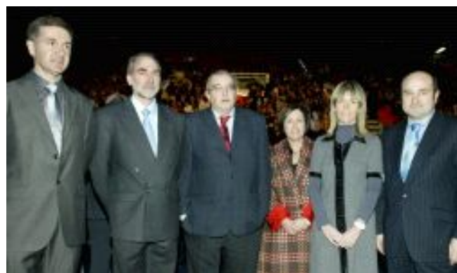
Los gerentes de las seis instituciones de Euskadi premiadas con Q de Oro