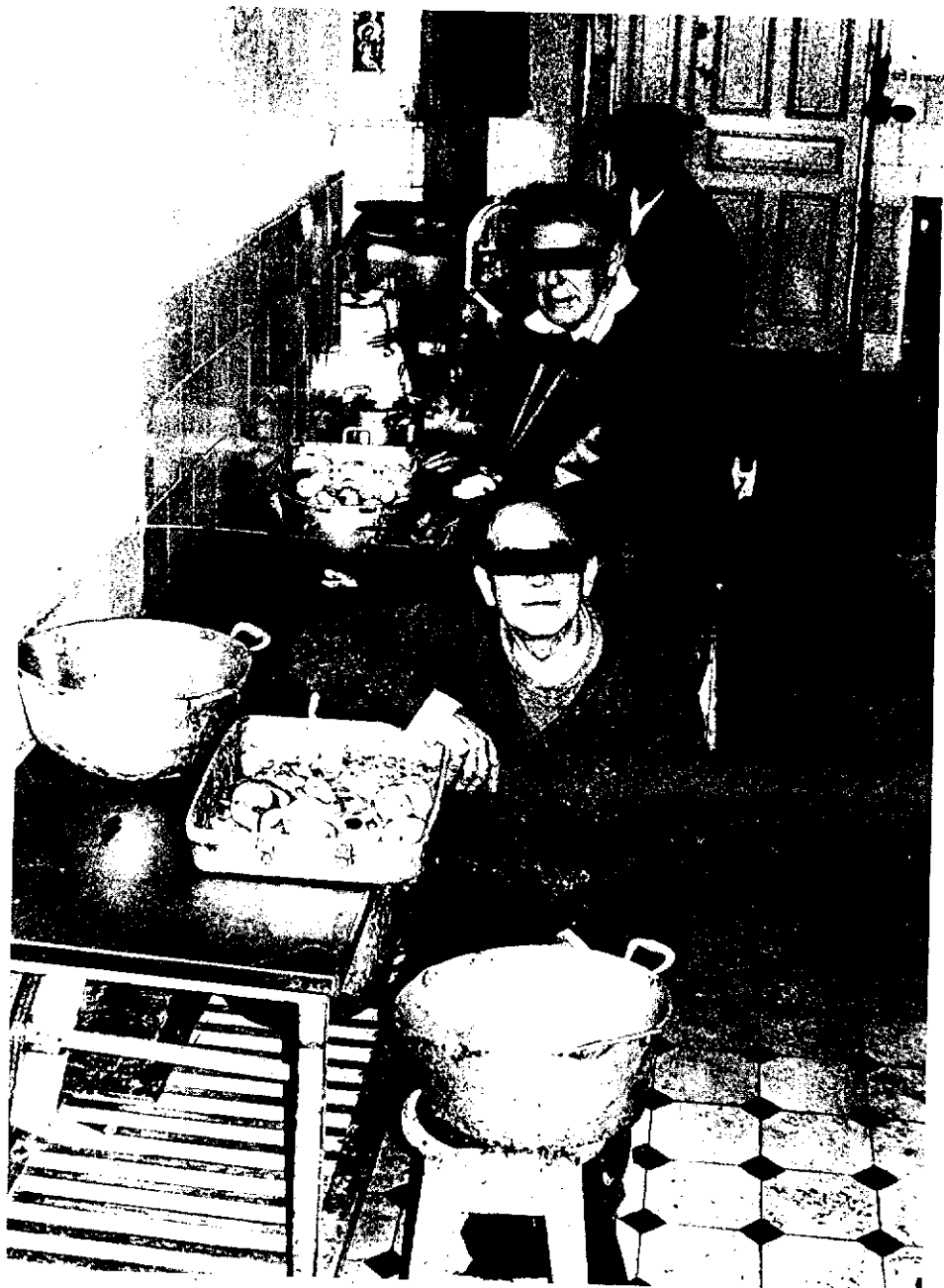
Trabajo de «rehabilitación»

columna para evitar que se golpeen entre ellos o a sí mismos. Los informes médicos sobre el centro indican que esta conducta agresiva puede tener su origen en el hecho mismo del prolongado encierro que estos niños abandonan sólo cuando hace buen tiempo y salen a un pequeño patio.